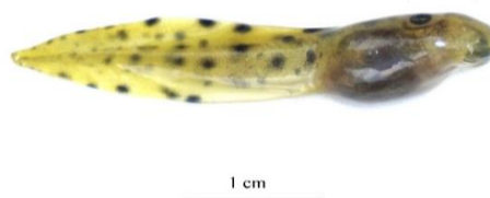
Hình 2. Nòng nọc loài Quasipaa delacouri (TDVT0046; Giai đoạn 25 Gosner [13])

Đuôi nòng nọc có bản rộng, các nếp vây đuôi bao phủ phía bên ngoài cơ đuôi, chiều cao đuôi lớn hơn chiều cao thân (ht/bh: 1,16–1,42) và nhỏ hơn 1/2 lần chiều dài đuôi (ht/tail: 0,32–0,39). Nếp trên vây đuôi kéo dài từ phía trước gốc đuôi đến mút đuôi, vị trí cao nhất của nếp trên vây đuôi nằm ở gần giữa đuôi. Chiều cao lớn nhất nếp trên vây đuôi bằng 0,36 lần chiều cao thân (uf/bh: 0,27–0,48) và bằng 0,3 lần cao đuôi (uf/ht: 0,23–0,36). Nếp dưới vây đuôi kéo dài từ phía sau bụng tới mút đuôi, vị trí cao nhất của nếp dưới vây đuôi nằm ở gần 1/3 phía mút đuôi. Chiều cao nếp dưới vây đuôi lớn hơn chiều cao nếp trên vây đuôi một chút (lf/uf: 0,83–1,45), bằng 0,37 lần chiều cao thân (0,31–0,43) và bằng 0,31 lần chiều cao đuôi (lf/ht: 0,27–0,33). Cơ đuôi hình chữ V, đáy nhọn hướng về phía trước, chiều cao lớn nhất của cơ đuôi (đo tại vị trí gốc đuôi) bằng 0,59 lần chiều cao thân (tmh/bh: 0,50–0,73) và bằng 0,49 lần chiều cao đuôi (tmh/ht: 0,37–0,62). Ống hậu môn gắn liền với gốc của nếp