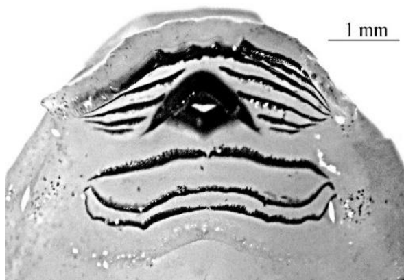
Hình 3. Miệng nòng nọc loài Quasipaa delacouri (TDVT0046; Giai đoạn 25; Gosner, 1960)

Thềm miệng: Phía trong bao hàm dưới, ở hai bên có các gai thịt tương tự như ở bao hàm trên, các gai thịt ở bao hàm dưới dài hơn và dày hơn, hướng vào phía trong miệng. Bên trong thềm miệng, các gai thịt có hình dạng và độ dài ngắn khác nhau, các gai thịt dài nằm về phía sau. Ở vị trí mầm của lưỡi có hai gai thịt dài, hình rẽ, hướng ra ngoài. Phía trong thềm miệng được giới hạn bởi một nếp da rộng, nằm phía trên các nếp mang, mép nếp da hình răng cưa. Mang có cấu trúc hình hoa.