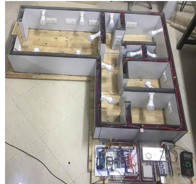
Hình 2.4. Mô hình thực hành điện thông minh cho căn hộ

Dựa trên sơ đồ khối điều khiển chiếu sáng, sơ đồ giao tiếp của bộ điều khiển và kết quả tìm hiểu về arduino, các loại cảm biến chúng tôi đã tiến hành xây dựng mô hình thực hành điện thông minh cho căn hộ như Hình 2.4.