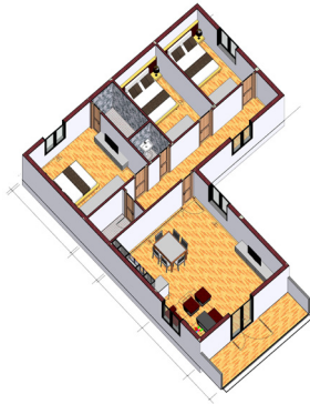
Hình 1. Phối cảnh mặt bằng căn hộ dùng trong mô hình thực hành

nhà vệ sinh. Căn hộ mô hình được làm từ vật liệu nhựa composite, các bức tường và vách có cấu trúc hai lớp và ở giữa có khe hở giúp cho việc đi dây dễ dàng.