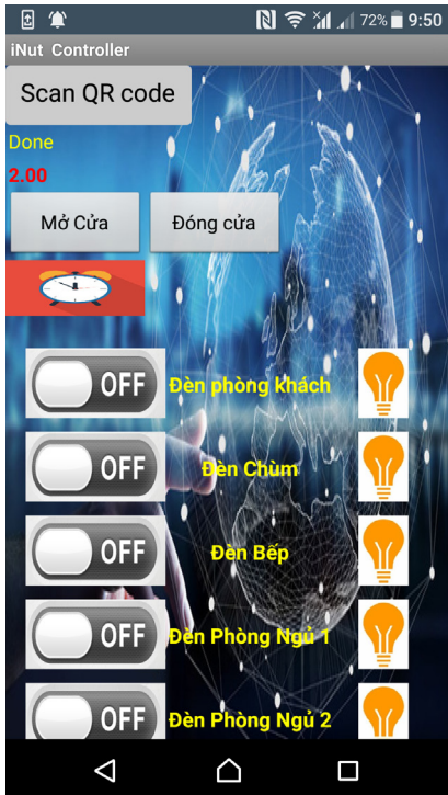
Hình 2.3b. Giao diện Webapp

Với phương thức điều khiển hệ thống dùng Webapp như mô tả ở trên, hệ chiếu sáng của căn hộ được thực hiện dễ dàng. Hình 2.3b mô tả sơ đồ khối cung cấp điện và điều khiển cho một đèn. Với sơ đồ này chúng ta có thể bật tắt đèn tại ba vị trí. Trong đó, hai vị trí tại công tắc 3 cực và công tắc 4 cực, vị trí còn lại tại bộ điều khiển từ xa thông qua Webapp. Khi bật đèn tại vị trí nào, nhờ có cảm biến dòng chúng ta có thể nhận biết được đèn bật hay tắt trên giao diện Webapp Hình 2.3b. Nếu bộ điều khiển trung tâm bị mất điện, chúng ta vẫn có thể bật tắt đèn bằng các công tắc thông thường.