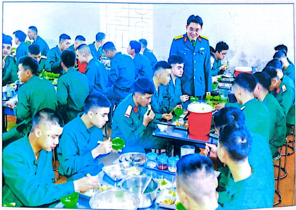
Bữa cơm đầu tiên của chiến sĩ mới tại Trung đoàn 764

Thủ trưởng Bộ CHQS tỉnh tặng hoa chúc mừng Hội Phụ nữ nhân dịp gặp mặt kỷ niệm 113 năm Ngày Quốc tế phụ nữ, 1983 năm Khởi nghĩa Hai Bà Trưng và 30 năm ngày truyền thống Phụ nữ Quân đội