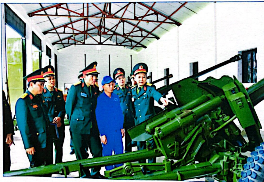
Ban Giám khảo Hội thi Chính quy ngành Kỹ thuật Quân khu 4 chấm thi tại Kho K70