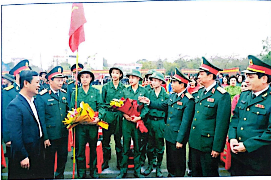
Thủ trưởng Bộ Tổng tham mưu, Quân khu 4, lãnh đạo tỉnh Nghệ An và Bộ CHQS tỉnh tặng hoa, động viên tân binh trước giờ lên đường nhập ngũ