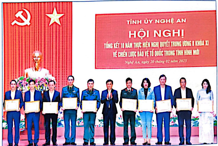
Đồng chí Bí thư Tỉnh ủy Thái Thanh Quý trao tặng Bằng khen của Ban Thường vụ Tỉnh ủy cho các tập thể có thành tích xuất sắc trong 10 năm thực hiện Nghị quyết Trung ương 8, khóa XI về “Chiến lược bảo vệ Tổ quốc trong tình hình mới”