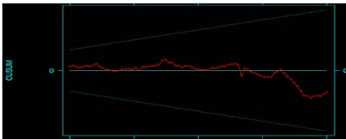
Hình 1: Kết quả kiểm định CUSUM